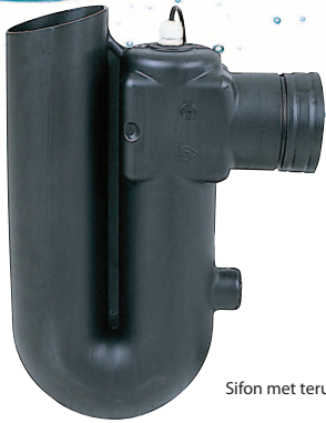
Sifon met terugslagalarm